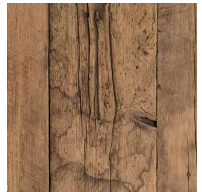
PLANCHER BRUT THRESHING FLOOR (PB)