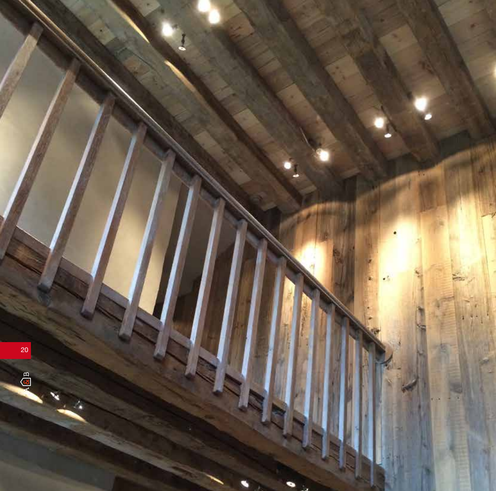
POUTRE TAILLÉE HACHE HAND HEWN BEAMS (PTH)