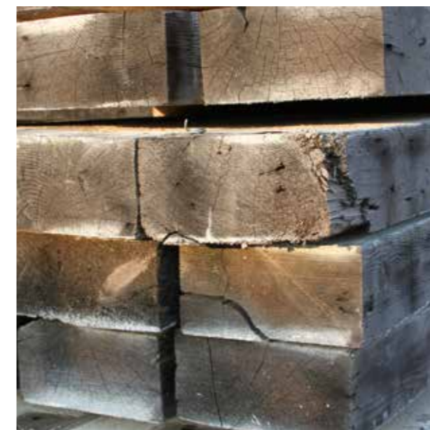
POUTRE DOUGLAS DOUGLAS BEAMS (PDOUG)